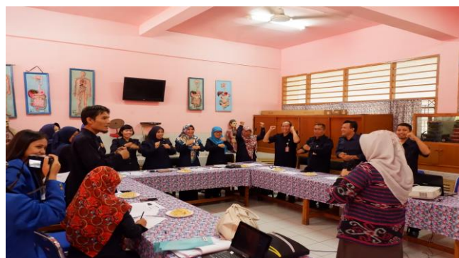
Gambar 3. Kegiatan Sosialisasi Literasi