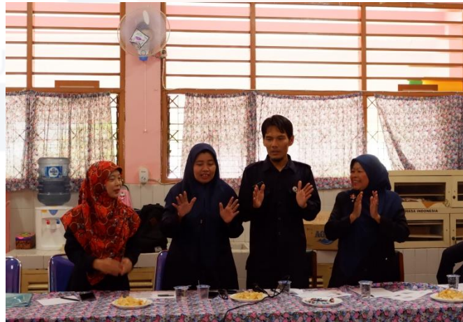
Gambar 4. Kegiatan simulasi kelompok